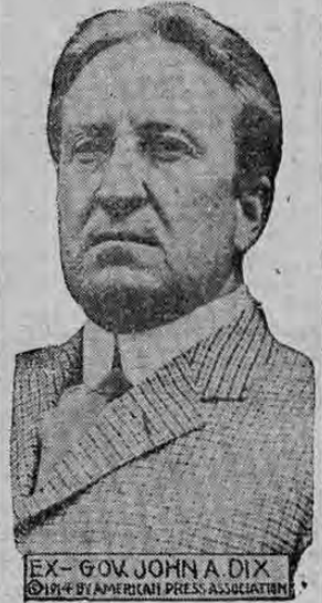
EX-GOV. JOHN A. DIX